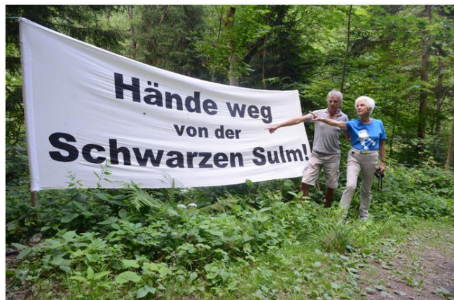
Freda Meissner-Blau und Ulrich Eichelmann vor Transparent im Lager

Vergangene Woche waren wir im Protestcamp an der Schwarzen Sulm, um vor Ort den Widerstand gegen das geplante Kraftwerk zu unterstützen. Auch Freda Meissner-Blau kam vorbei und schloss sich dem Widerstand an, ebenso wie Global 2000. Photos hier: http://riverwatch.eu/allgemein/freda-meissner-blau-und-global-2000-an-der-schwarzen-sulm