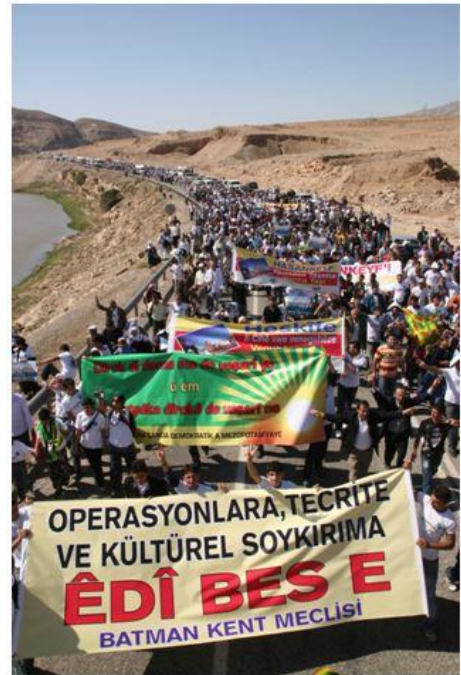
Proteste gegen den Ilisu Staudamm in Hasankeyf. Der Bau schreitet voran, die Proteste gehen weiter.

http://riverwatch.eu/ilisu/aufstand-in-der-turkei-hoffnung-fur-ilisu-und-co