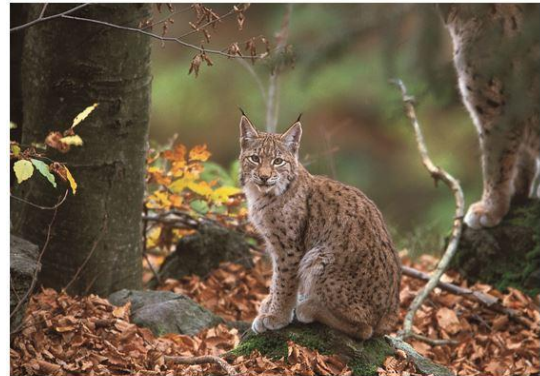
Staudämme gefährden die letzten Balkanluchse im Mavrovo Nationalpark

Bitte unsere Petition unterzeichnen: https://www.regenwald.org/aktion/947/kein-e-staudaemme-im-mavrovo-nationalpark