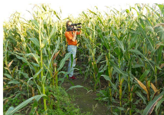
Dreharbeiten zu Climate Crimes

www.oekofilmtour.de/0321e2a31e0a78d02.html