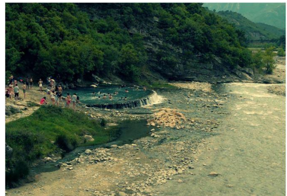
Thermalquellen an der Langarica, AL.

Die Weltbank finanziert drei Staudammprojekte an der Langarica (ein Zufluss der Vjosa) innerhalb des Hotovës-Dangelli Nationalparks, Albanien. Eines ist bereits fertiggestellt, ein anderes ist im Bau. Dadurch sind beliebte Thermalquellen vorübergehend ausgetrocknet, was dutzende Menschen dazu bewegt hat am 11. Oktober in Tirana gegen die Staudämme zu protestieren. Daraufhin hat der Umweltminister versprochen eine Arbeitsgruppe einzurichten, der Bau wurde allerdings wieder aufgenommen.