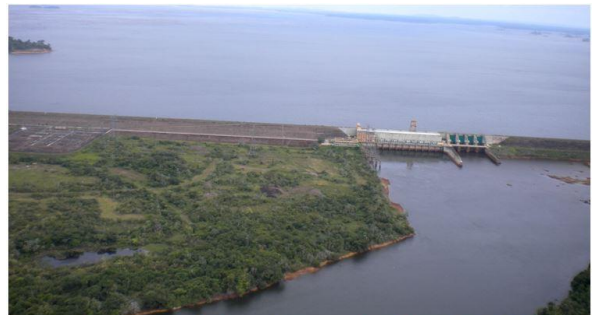
Stausee Balbina nördlich von Manaus/Brasilien. 230.000 Hektar Urwald verrotten in diesem Stausee.

Wasserkraftwerke gelten als klimafreundlich. Doch in Sachen Treibhausgas-Ausstoß sind Stauseen alles andere als vorbildlich. Lesen Sie dazu aus dem Handelsblatt: Wie Staudämme dem Klima schaden