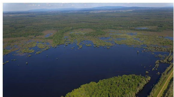
Die natürlichen Überschwemmungsflächen der Save im Lonjsko Polje Naturpark.

Mitte September ist die Save erneut über ihre Ufer getreten. Lesen Sie über die Ursachen und die daraus gezogenen Lehren in unserer Pressemitteilung . Der Standard hat das Thema aufgegriffen „ Der trügerische Schutz der Flussrinnen “